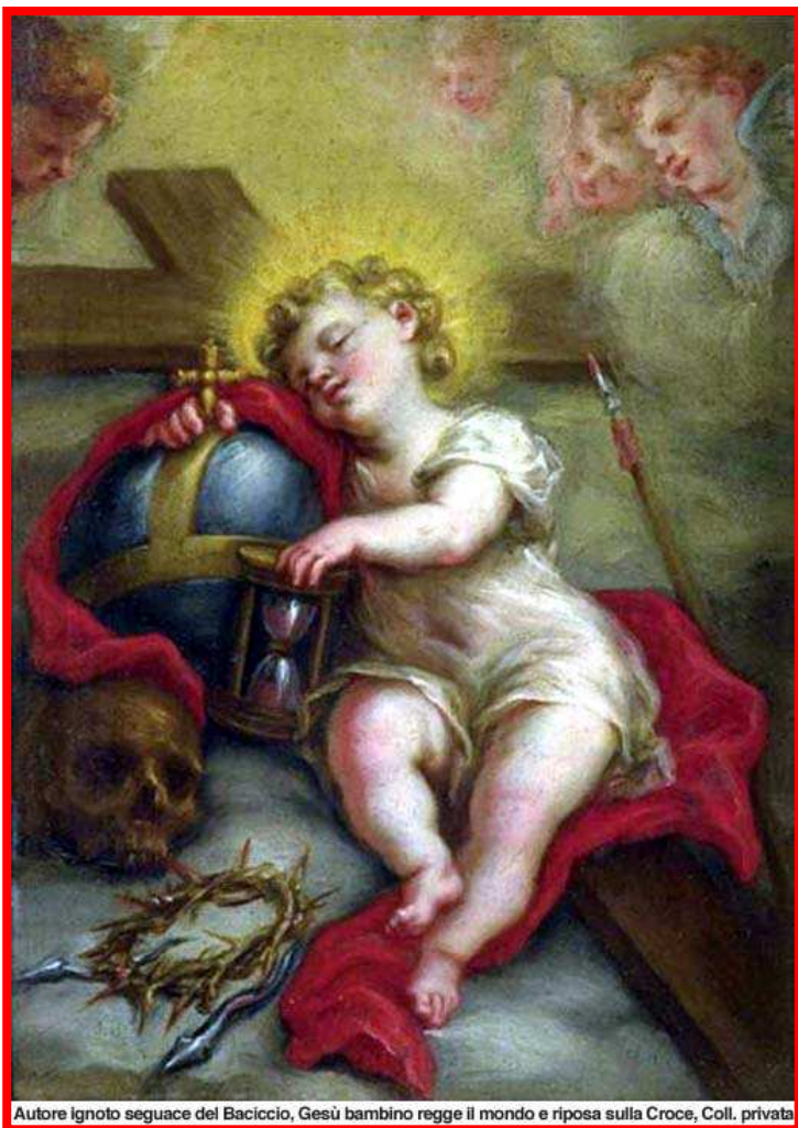
Autore ignoto seguace del Baciccio, Gesù bambino regge il mondo e riposa sulla Croce, Coll. privata